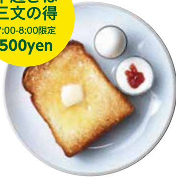
MORNING PLATE TOAST+BOILED OR FRID EGG+YOGURT モーニングプレート 680