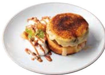
BRIOCHE AND APPLE CREME BRULEE プリオッシュとりんごの クレームブリュレ 1200