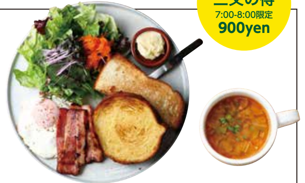
NOWADAYS MORNING PLATE MORNING PLATE+MINI SOUP ナワデイズ モーニングプレート 1100