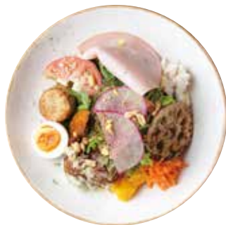
MARKET SALAD BOWL ORGANIC SALAD+SOFT BOILED EGG+PROSCIUTTO COT +VEGETABLE DELI+FRUIT マーケットサラダボウル 1000