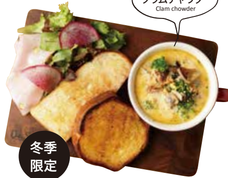
CLAM CHOWDER SOUP BOARD CHOWDER+ORGANIC SALAD +BRIOCHE+BREAD+MORTADELLA クラムチャウダーのスープボード 1200