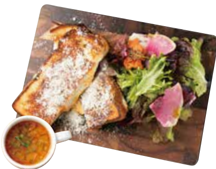
BOLOGNESE AND HOT SANDWICH HOT SAND+SALAD+SOUP ボロネーゼと3種のチーズのホットサンド 1100

Please choose from the set drinks listed at the bottom