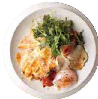
RICE BOWL RICE W/CHEESE TOMATO+1/2 SAUSAGE SOFT BOILED EGG+CHICKEN+SALAD ライスボウル 900